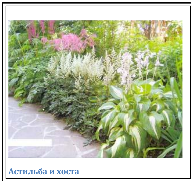
Астильба и хоста

Но переувлажненный участок – половина беды. Обилие воды чаще всего сочетается с высокой кислотностью почв, которая большинству растений не по душе. Поэтому, выбирая растения для посадки вокруг пруда, обратите на это внимание. Например, осокам высокая влажность не помеха, а их зелень отлично оттеняет другие, цветущие, растения. А некоторые виды и сами имеют оригинальные соцветия и плоды. Из цветущих растений неплохо приживутся на берегу пруда волжанка, лабазники, вербейник, калужница. Для остальных растений, которые хорошо переносят влажность и способны украсить берег пышным цветением, потребуется подготовить почву – из песка, глины и плодородной земли, слоем не менее 20–25 см. После этого на берегу можно смело посадить волжанку, астильбу, бруннеру, купальницу, лилейники, ирисы, дербенник. Около пруда хорошо будут смотреться ивы, особенно их плакучие формы, правда для них плодородная «грядка» должна быть еще больше: ивы не в восторге от